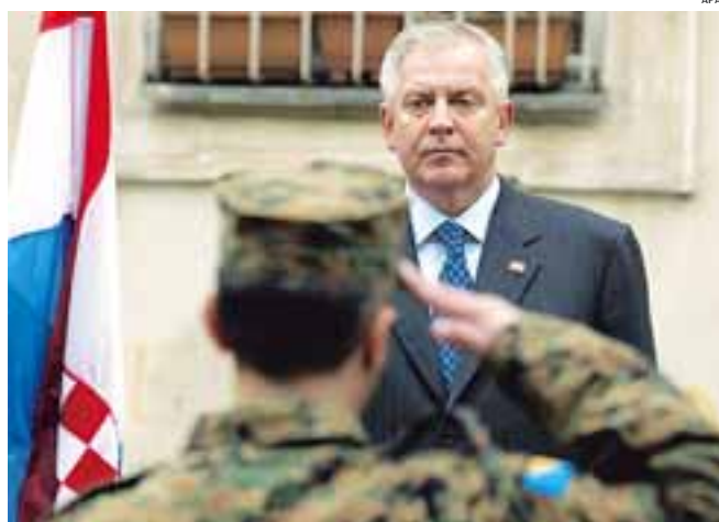
Kroatiens Premierminister Ivo Sanader will die Telekom-„Volksaktie“ kurz vor den Wahlen debütieren lassen

Zagreb. Der von der kroatischen Regierung nach mehreren Verschiebungen zuletzt für „Mai/Juni 2007“ angekündigte Verkauf eines 20-prozentigen Aktienpakets an der staatlichen Telekomfirma HT dürfte vor Herbst nicht über die Bühne gehen, berichten kroatische Medien. Beobachter der Lage sagen zudem, dass Herbst 2007 von Anfang an der einzig denkbare Termin war – schliesslich soll, so wie die Aktie des Ölkonzerns Ina, auch die HT zur „Volksaktie“ werden, was der Regierungspartei HDZ von Premier Ivo Sanader kurz vor den Oktoberwahlen Zusatzpunkte bringen soll. 42 Prozent der HT sind noch staatlich.