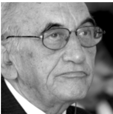
Tadeusz Mazowiecki b. Premier RP

Unia Europejska to nie jest cała Europa i długo jeszcze nie będzie, a może nie będzie w ogóle. Współpraca z tymi krajami, które będą poza Unią, zwłaszcza krajami Wschodniej Europy, stanowi bardzo istotny element. Jacy my, przystępujący do Unii, będziemy? Jaka będzie nasza gospodarka, instytucje obywatelskie i jakie będzie nastawienie dotychczasowych członków Unii? Wstępujemy do Unii bez kompleksów i bez kompleksów chcemy w niej być obecni.