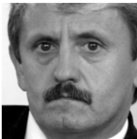
Mikuláš Dzurinda Premier Republiki Słowacji

Forum przyczynia się do dalszego pomyślnego rozwoju współpracy między państwami Europy Środkowej i Wschodniej. Dobra sytuacja polityczna i gospodarcza wszystkich krajów Europy Środkowo-Wschodniej leży w interesie nas wszystkich. Forum w Krynicy zwiększa naszą determinację w dążeniu do współpracy. Daje nam również doskonałą możliwość przyczynienia się do realizacji idei wolnej i zjednoczonej Europy.