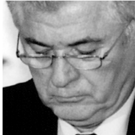
Władimir Woronin Prezydent Republiki Mołdowy

Wspólna przyszłość polityczna nie może istnieć w warunkach linii demarkacyjnych. Istniejącą Europę widzimy jako Europę silną, gotową bronić swojego bezpieczeństwa, która chroni swoje interesy dyplomatyczne, przemysłowe i handlowe, oczywiście w ramach różnorodności kulturowej.