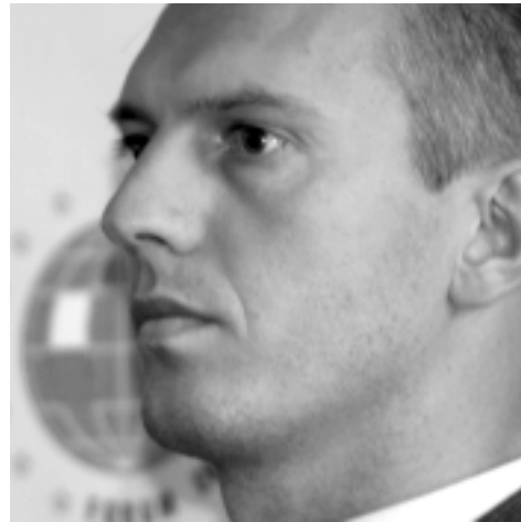
Valeriy Khoroshkovsky Minister Gospodarki i Integracji Europejskiej Ukrainy

Unia Europejska zdefiniowała pewną przepaść między sukcesem a niepowodzeniami związanymi z elektroniką i to stanowi ogromne zagrożenie. Musimy zatem jeszcze bardziej współpracować z przemysłem, z politykami, z uniwersytetami i różnymi szkołami w tej dziedzinie.