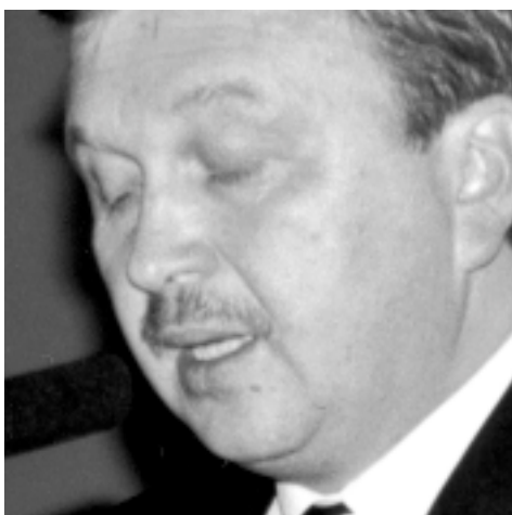
Andriej Kobiakow Minister Gospodarki Białorusi

Kiedy rozmawiamy na temat przyszłości, wówczas pojawia się to samo pytanie: jak długo jeszcze Europa pozostanie podzielona. Ale kiedy spojrzymy wstecz na minioną dekadę, możemy dojść do wniosku, że przepaść między nami a zachodnią częścią Europy, udało nam się zmniejszyć pod wieloma względami. Przypomnijmy tylko podział pomiędzy naszym wspólnym wielkim światem a światem pragnącym wolności. Ten podział polityczny już dzisiaj nie istnieje. Ale jeżeli dochodzą do głosu podziały ekonomiczne i kiedy przyjrzymy się wzrostowi ekonomicznemu państw Europy Środkowej, to możemy nawet stwierdzić, że istnieje kilka państw w Europie centralnej, których wzrost jest nawet podwójny w stosunku do wzrostu niektórych państw Europy Zachodniej. Począwszy od Bałtyku aż do Adriatyku powstaje nowa strefa wzrostu na obrzeżach Europy, która konsoliduje się z Europą Zachodnią.