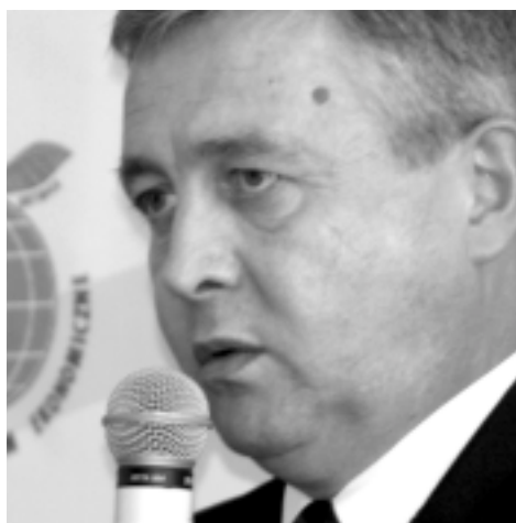
Vladimir Shemashko Wicepremier Republiki Białorusi

Unia Europejska to nie jest cała Europa i długo jeszcze nie będzie, a może nie będzie w ogóle. Współpraca z tymi krajami, które będą poza Unią, zwłaszcza krajami Wschodniej Europy, stanowi bardzo istotny element. Jacy my, przystępujący do Unii, będziemy? Jaka będzie nasza gospodarka, instytucje obywatelskie i jakie będzie nastawienie dotychczasowych członków Unii? Wstępujemy do Unii bez kompleksów i bez kompleksów chcemy w niej być obecni.