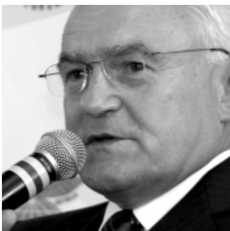
Leszek Miller b. Premier RP

Transformacja chińskiego systemu gospodarczego z planowego na rynkowy wywiera przemożny wpływ na rozwój przedsiębiorstw. Oprócz wytyczenia sobie i realizowania strategii rozwoju, przedsiębiorstwo musi jeszcze wziąć pod uwagę konieczność podnoszenia poziomu całości zarządzania przedsiębiorstwem. Musi także wziąć pod uwagę konieczność stworzenia zdrowej kultury korporacyjnej oraz stopniowe przemiany w firmie, które najpierw trzeba testować w małej skali, a dopiero potem rozposzechnić na większą.