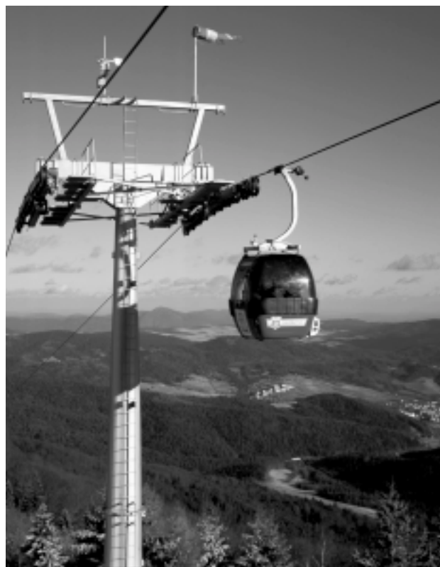
Wycieczka kolejką gondolową na Jaworzynę, najwyższy szczyt Beskidu Sądeckiego (1114 m. n.p.m.)