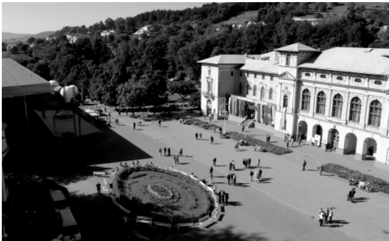
Deptak w Krynicy Zdrój, perły polskich uzdrowisk