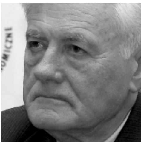
Valdas Adamkus b. Prezydent Republiki Litwy

Forum Ekonomiczne w Krynicy potwierdza, że razem budujemy nasz wspólny europejski dom i tylko demokratyczne obywatelskie społeczeństwo i efektywna gospodarka rynkowa może sprzyjać postępowi na tej drodze.