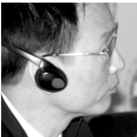
Miao Gengshu Senator Chińskiej Republiki Ludowej Prezes China Minmetals Group

Transformacja chińskiego systemu gospodarczego z planowego na rynkowy wywiera przemożny wpływ na rozwój przedsiębiorstw. Oprócz wytyczenia sobie i realizowania strategii rozwoju, przedsiębiorstwo musi jeszcze wziąć pod uwagę konieczność podnoszenia poziomu całości zarządzania przedsiębiorstwem. Musi także wziąć pod uwagę konieczność stworzenia zdrowej kultury korporacyjnej oraz stopniowe przemiany w firmie, które najpierw trzeba testować w małej skali, a dopiero potem rozposzechnić na większą.