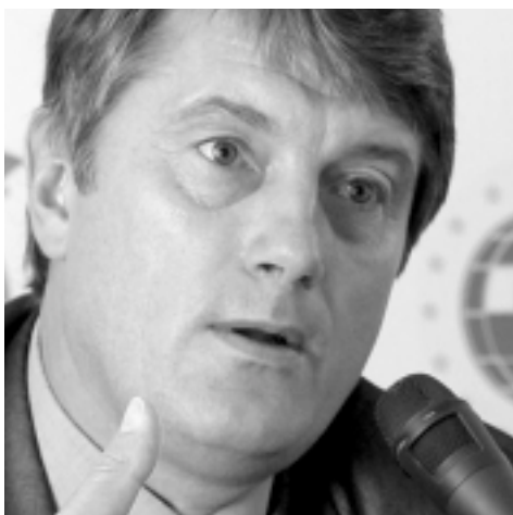
Wiktor Juszczenko , b. Premier Deputowany Rady Najwyższej Ukrainy

Najważniejszą sprawą nie jest regulacja zapisana w prawie. Nie chodzi tylko o dokument. Najważniejsza jest bowiem różnica pomiędzy tym co jest napisane a tym co jest wykonywane. To największe wyzwanie w gospodarkach przejściowych.