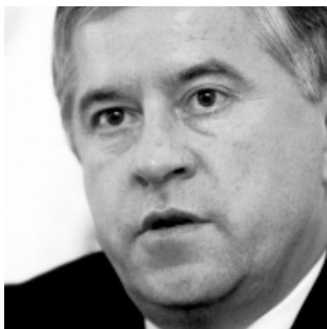
Anatolij Kinach , b. Premier Ukrainy

Jeśli zintegrowana i poszerzona Europa chce wyraźnie przyczynić się do rozwiązania problemów bezpieczeństwa, a Europa jest odpowiedzią na proces globalizacji, musi być w stanie sformułować własną politykę zagraniczną i politykę bezpieczeństwa.