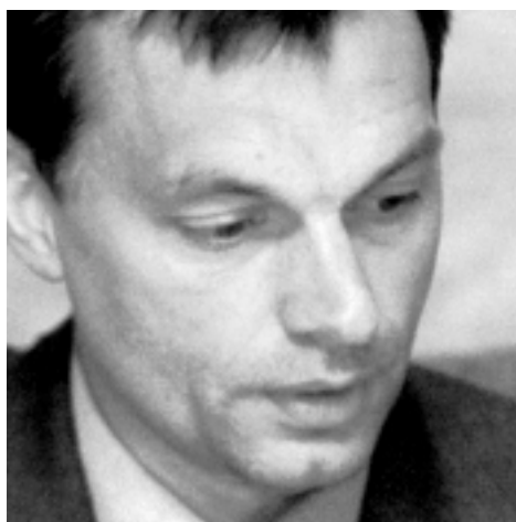
Victor Orbán Premier Węgier

To dla mnie duży honor i radość, że mogę być obecny w malowniczej Krynicy oddalonej tylko o 12 kilometrów od północnej granicy Słowacji, za którą znajduje się Polska, sąsiad słowackiemu sercu nadzwyczaj bliiski. W miejscu, gdzie odbywa się wyjątkowo ważne forum dyskusyjne, które od chwili swojego powstania wpływa pozytywnie na stosunki pomiędzy krajami Europy Środkowej i Wschodniej.