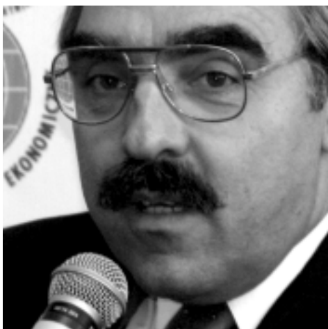
Lajos Bokros b. Minister Finansów Węgier, Dyrektor w Banku Światowym

Najważniejszą sprawą nie jest regulacja zapisana w prawie. Nie chodzi tylko o dokument. Najważniejsza jest bowiem różnica pomiędzy tym co jest napisane a tym co jest wykonywane. To największe wyzwanie w gospodarkach przejściowych.