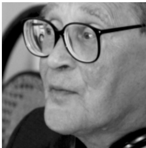
Sergiej Kowaliov Deputowany do Dumy Państwowej Federacji Rosyjskiej

to wręcz haniebne – działa cenzura polityczna. To kraj, który nie jest praworządny, w którym człowiek nie może obronić swoich praw w sądzie. Dwie trzecie społeczeństwa znajduje się poniżej granicy ubóstwa.