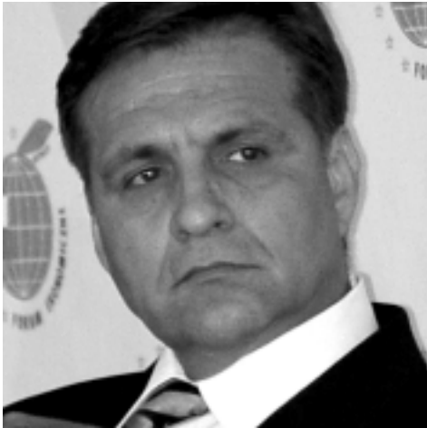
Boris Trajkovski b. Prezydent Republiki Macedonii

Droga do pełnej integracji jest bardzo kręta. Wymaga nie tylko dużego nakładu sił ze strony poszczególnych państw, ale również intensywnej współpracy, poparcia i solidarności pomiędzy naszymi krajami. (...) Biorąc pod uwagę uwarunkowania społeczne, gospodarcze i polityczne należy stwierdzić, że każde państwo ma prawo marzyć o tym, że już w niedalekiej przyszłości, stanie się częścią tego strategicznego projektu, jakim jest Unia Europejska, że uczestniczyć będzie w tworzeniu nowej wizji oraz lepszego oblicza świata. Nasza wspólna przyszłość oparta jest na tych samych wartościach, które są głęboko wbudowane w korzenie wszystkich demokratycznych społeczeństw.