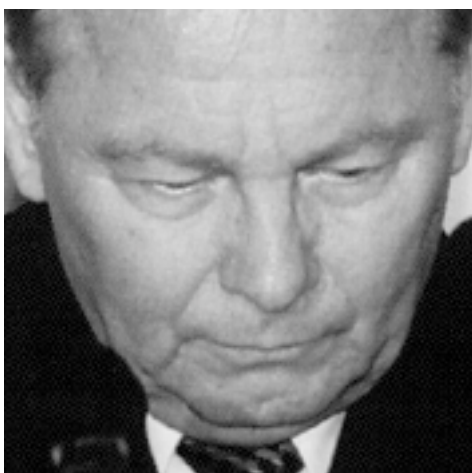
Rudolf Schuster Prezydent Republiki Słowackiej

To dla mnie duży honor i radość, że mogę być obecny w malowniczej Krynicy oddalonej tylko o 12 kilometrów od północnej granicy Słowacji, za którą znajduje się Polska, sąsiad słowackiemu sercu nadzwyczaj bliiski. W miejscu, gdzie odbywa się wyjątkowo ważne forum dyskusyjne, które od chwili swojego powstania wpływa pozytywnie na stosunki pomiędzy krajami Europy Środkowej i Wschodniej.