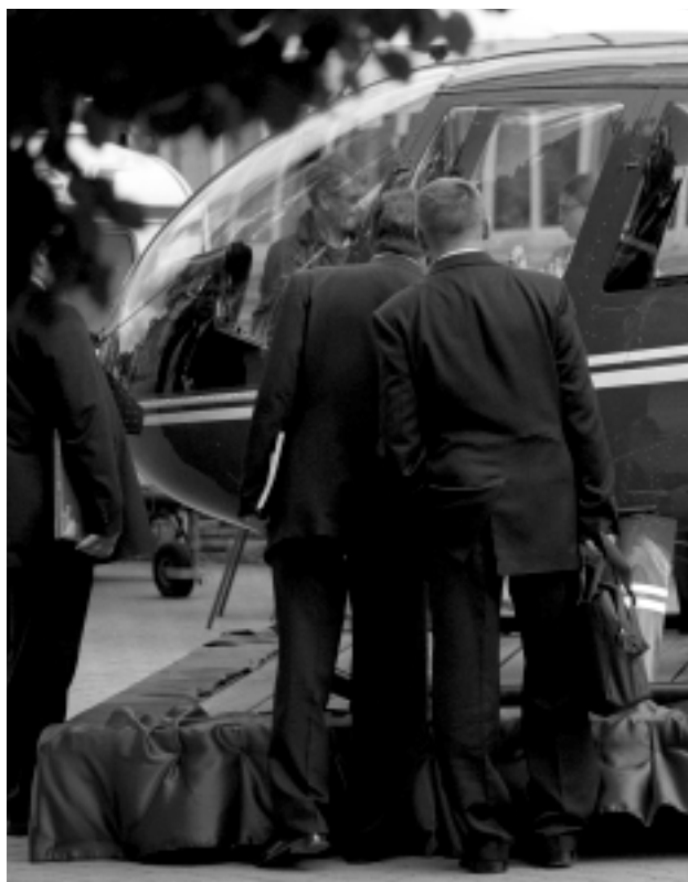
Robinson R44. To latająca, bardzo cicha taksówka, startująca i lądująca praktycznie w każdych warunkach terenowych