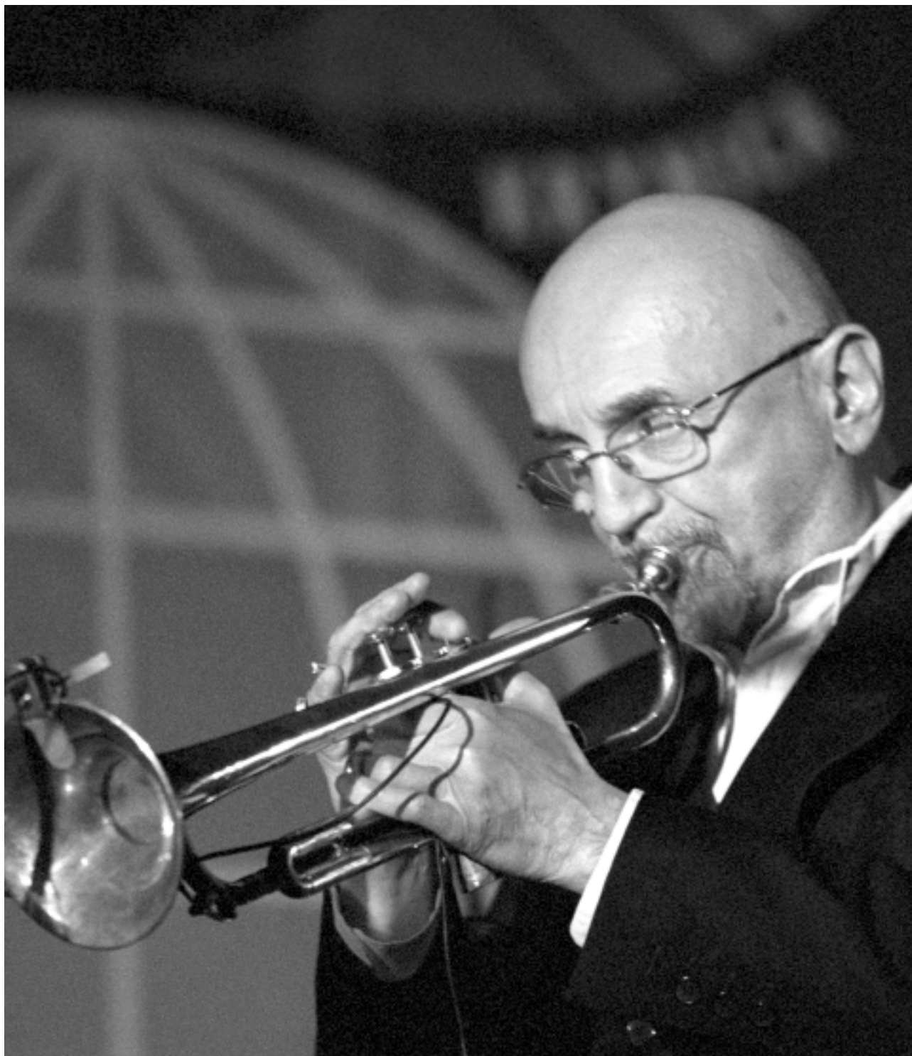
Tomasz Stańko gra w trakcie ceremonii wręczenia Nagród Forum Ekonomicznego