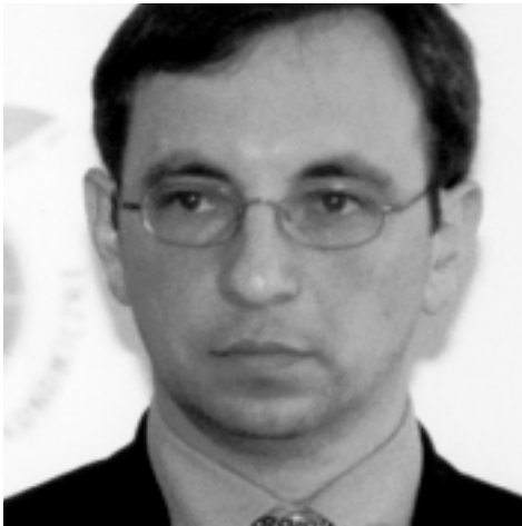
Nikolay Vassilev Wicepremier i Minister Gospodarki Republiki Bułgarii

Wspólna przyszłość polityczna nie może istnieć w warunkach linii demarkacyjnych. Istniejącą Europę widzimy jako Europę silną, gotową bronić swojego bezpieczeństwa, która chroni swoje interesy dyplomatyczne, przemysłowe i handlowe, oczywiście w ramach różnorodności kulturowej.