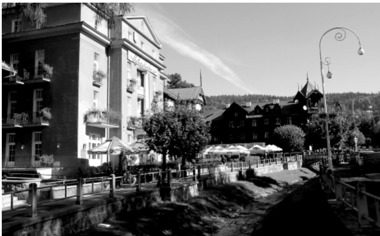
Krynica Zdrój, pensjonaty Matopolanka i Witoldówka