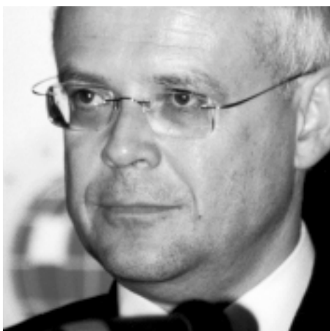
Vladimír Špidla , Premier Czech

Jeśli zintegrowana i poszerzona Europa chce wyraźnie przyczynić się do rozwiązania problemów bezpieczeństwa, a Europa jest odpowiedzią na proces globalizacji, musi być w stanie sformułować własną politykę zagraniczną i politykę bezpieczeństwa.