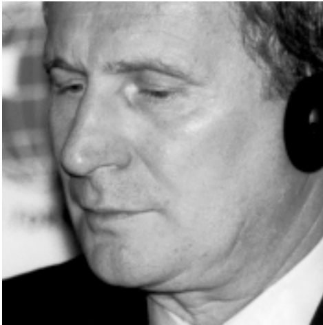
Zsigmont Jarai Prezes Narodowego Banku Węgier