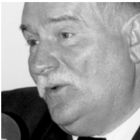
Lech Wałęsa b. Prezydent RP