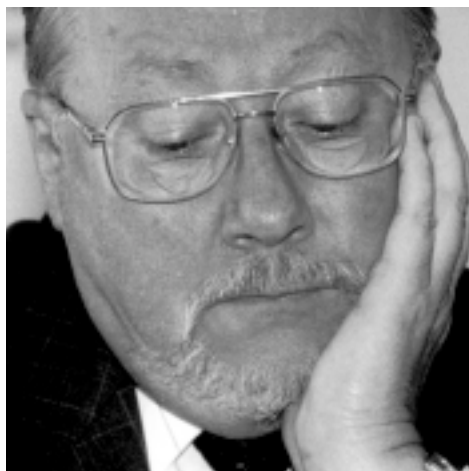
Vytautas Landsbergis b. Przewodniczący Parlamentu Litwy