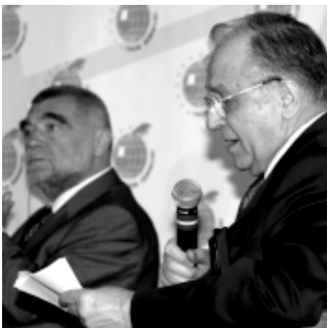
Stjepan Mesić Prezydent Republiki Chorwacji Ion Iliescu Prezydent Rumunii

Droga do pełnej integracji jest bardzo kręta. Wymaga nie tylko dużego nakładu sił ze strony poszczególnych państw, ale również intensywnej współpracy, poparcia i solidarności pomiędzy naszymi krajami. (...) Biorąc pod uwagę uwarunkowania społeczne, gospodarcze i polityczne należy stwierdzić, że każde państwo ma prawo marzyć o tym, że już w niedalekiej przyszłości, stanie się częścią tego strategicznego projektu, jakim jest Unia Europejska, że uczestniczyć będzie w tworzeniu nowej wizji oraz lepszego oblicza świata. Nasza wspólna przyszłość oparta jest na tych samych wartościach, które są głęboko wbudowane w korzenie wszystkich demokratycznych społeczeństw.